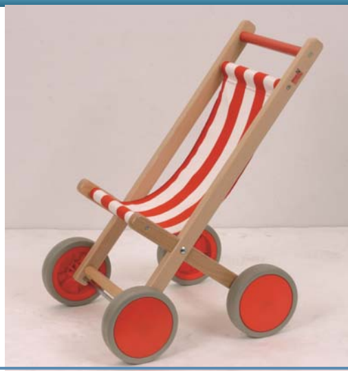
Referência B370639 DESIGNAÇÃO CARRO DE BONECAS