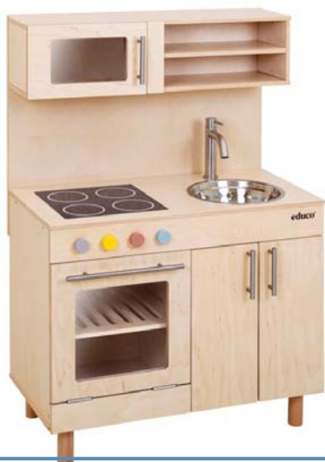
Referência 2201.06.0347 DESIGNAÇÃO COMBINADO COZINHA MADEIRA