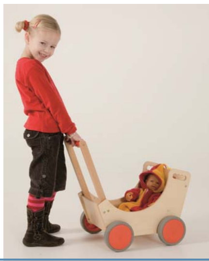
Referência 2213.99.522495 DESIGNAÇÃO CARRINHO DE BONECA 50X26X49CM MAD