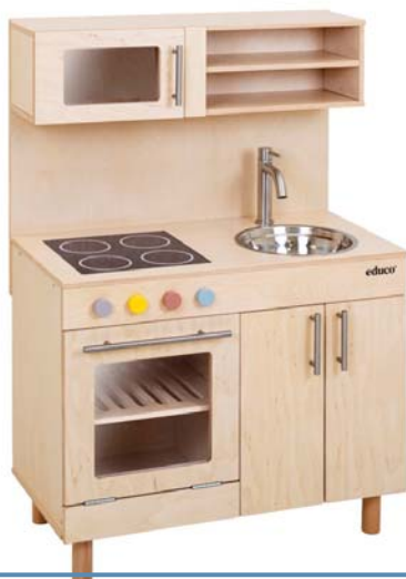
Referência 2201.06.0347 DESIGNAÇÃO COMBINADO COZINHA MADEIRA